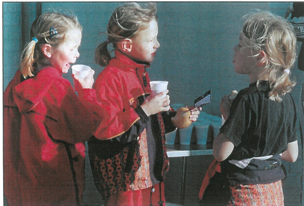
Skolernes motionsdag: Bagefter gav skoletandplejen saftvand og boller.