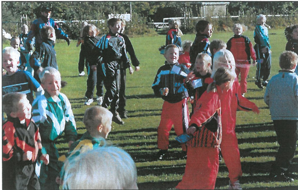
Skolernes motionsdag. Så er der opvarmning før løbet.