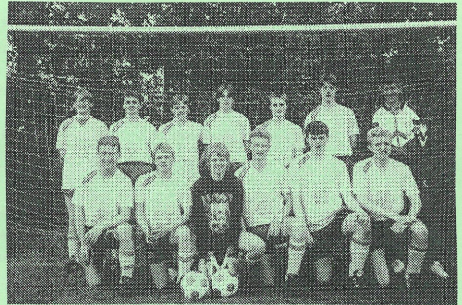
Juniorfodboldholdet vandt JUNIOR 4 CUP.