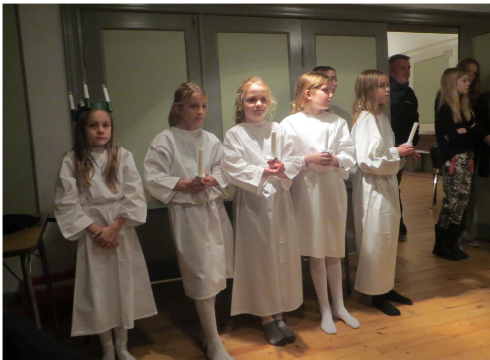
Pigerne i Luciaoptoget ved seniorklubbens juleafslutning