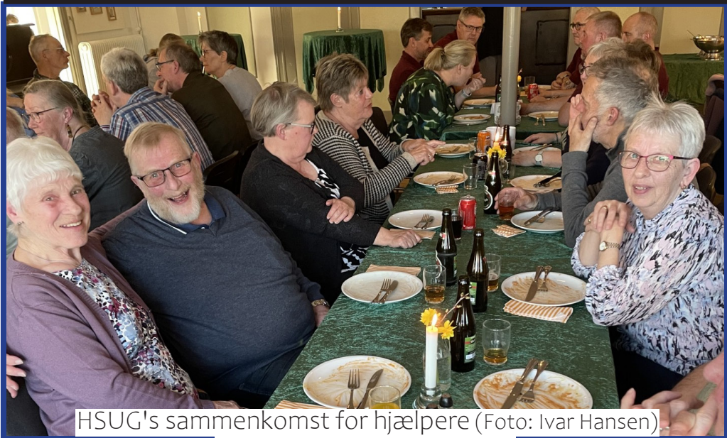
HSUG's sammenkomst for hjælpere