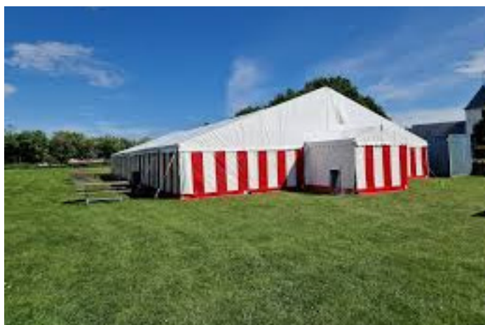
Landsbyfesten 2025