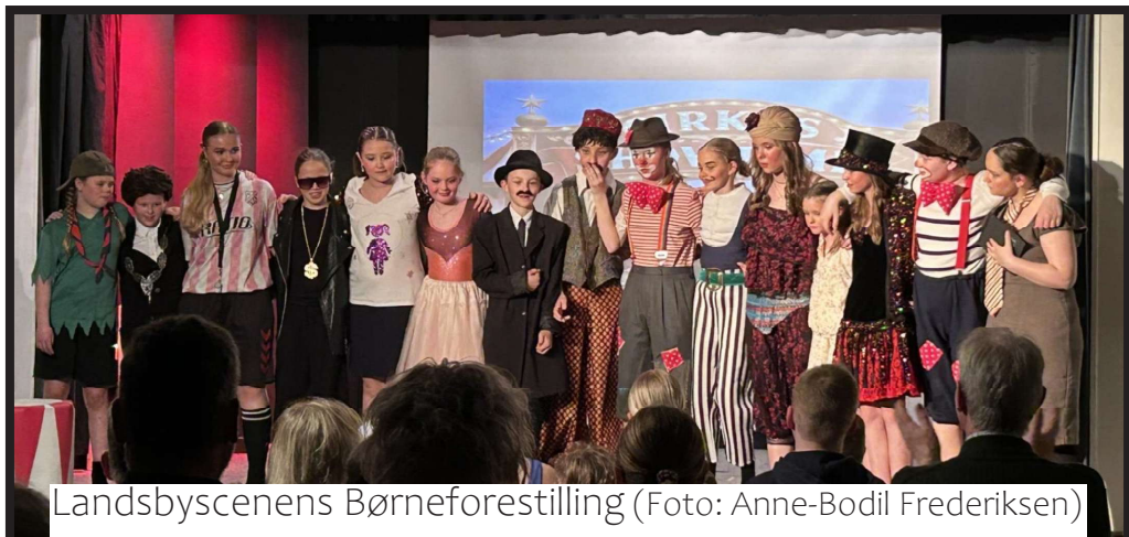
Landsbyscenens Børneforestilling