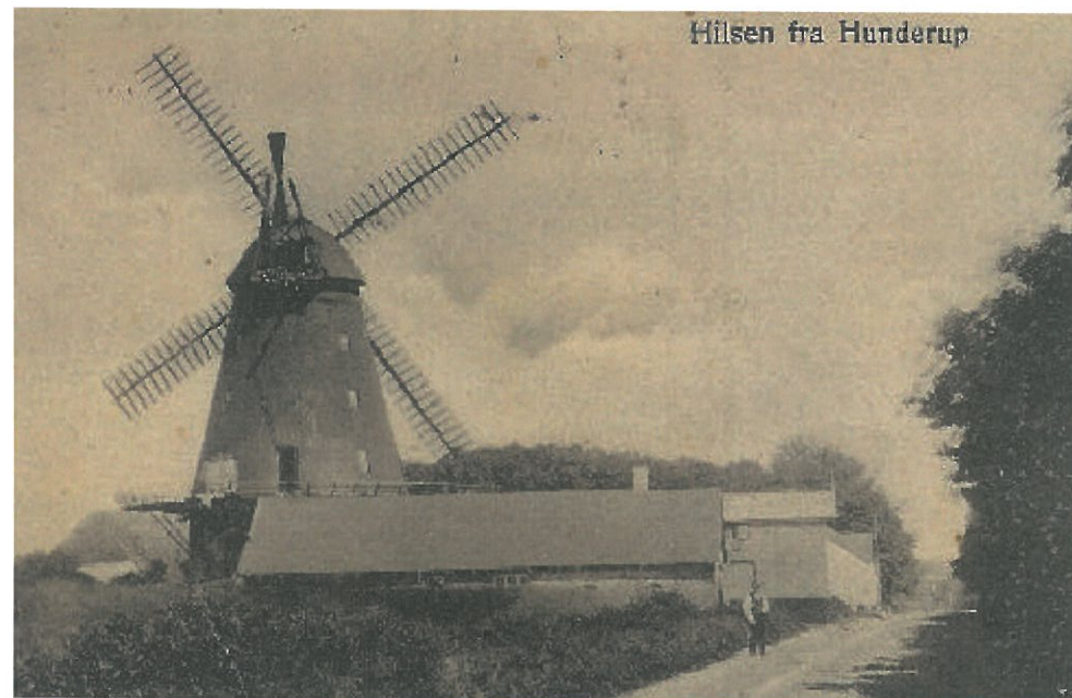
Hilsen fra Hunderup

I maj-nummeret af LandsbyPosten var forsidebilledet et maleri af Hunderup Mølle, malet i 1920 (se det lille billede til højre. Niels Bertelsen har været forbi med dette gode billede af Hunderup Mølle (se ovenfor), som må være optaget 1909 eller lidt før (dateret 1909)