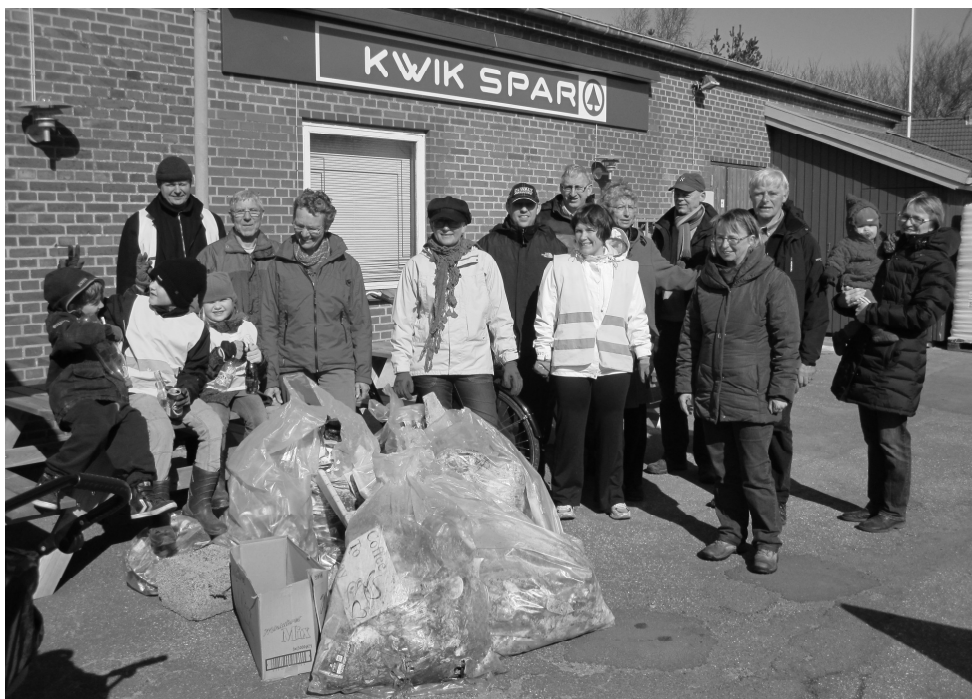
De fleste af deltagerne med en del af det indsamlede affald