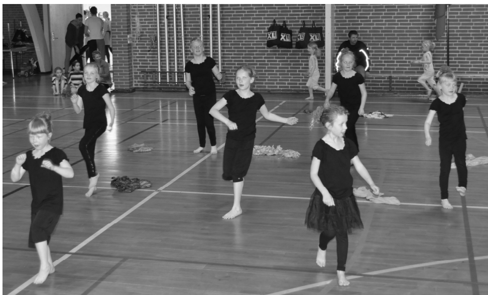
Billeder fra årets gymnastikopvisning