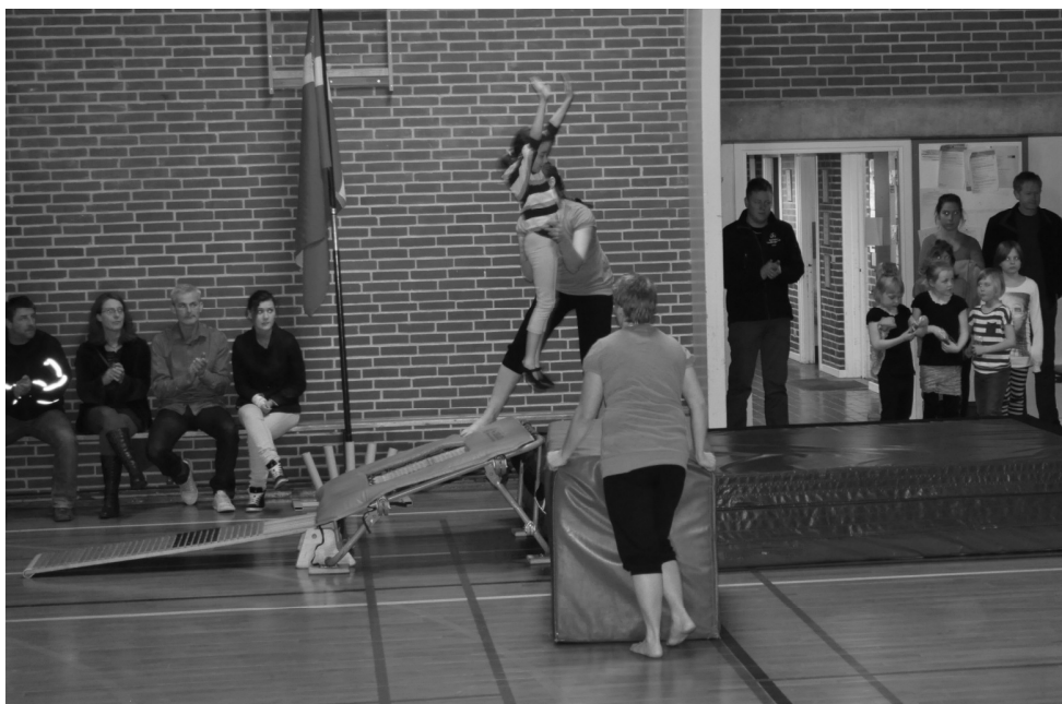
Billeder fra årets gymnastikopvisning