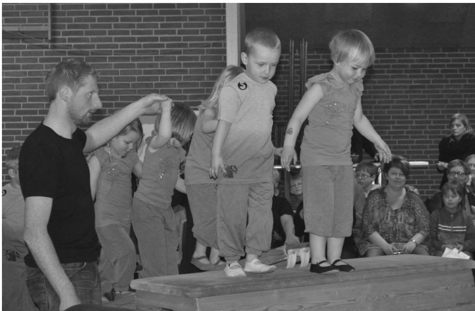
Billeder fra årets gymnastikopvisning