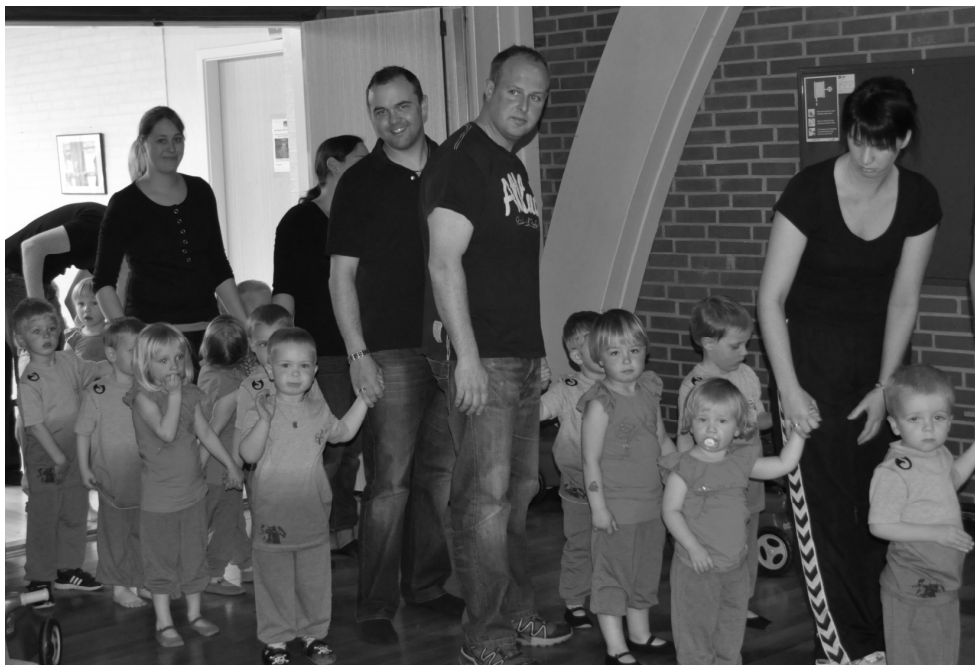
De små gymnaster klar til indmarch.