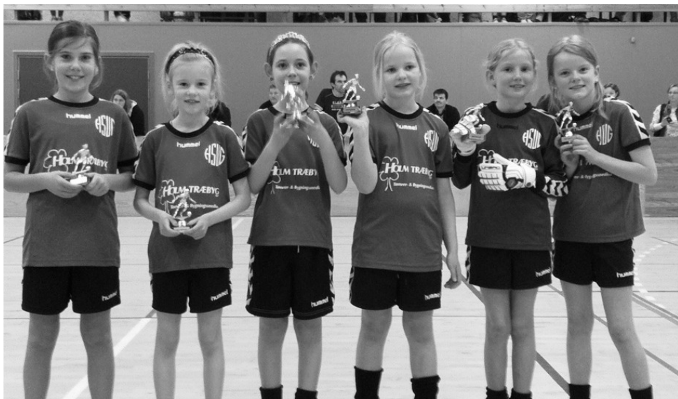
En flok stolte U10 piger opnåede fildspræmie for deltagelse i 7 minihalstævner i løbet af vinteren