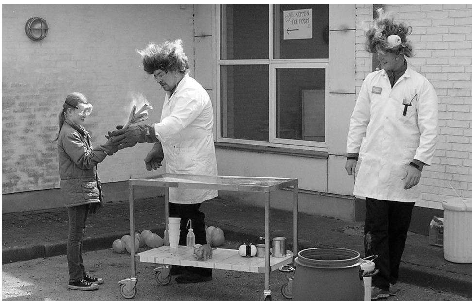
Danfoss Universe underholder med kemishow