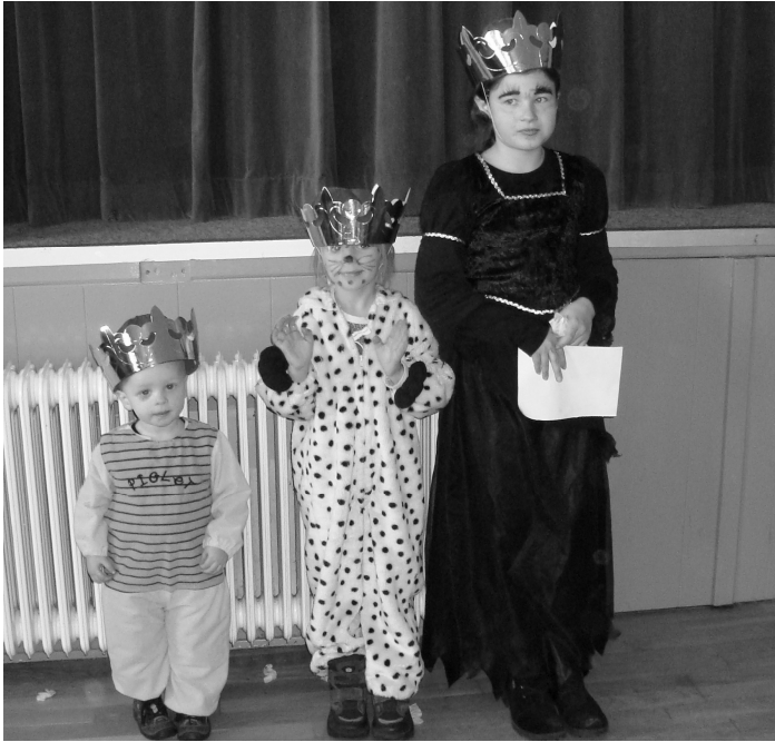
Fastelavnsfestens 3 Kattekonger