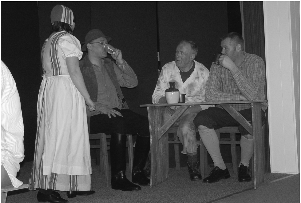
Roverne fra Rold havde stor succes med 400 tilskuere til de 4 forestillinger.