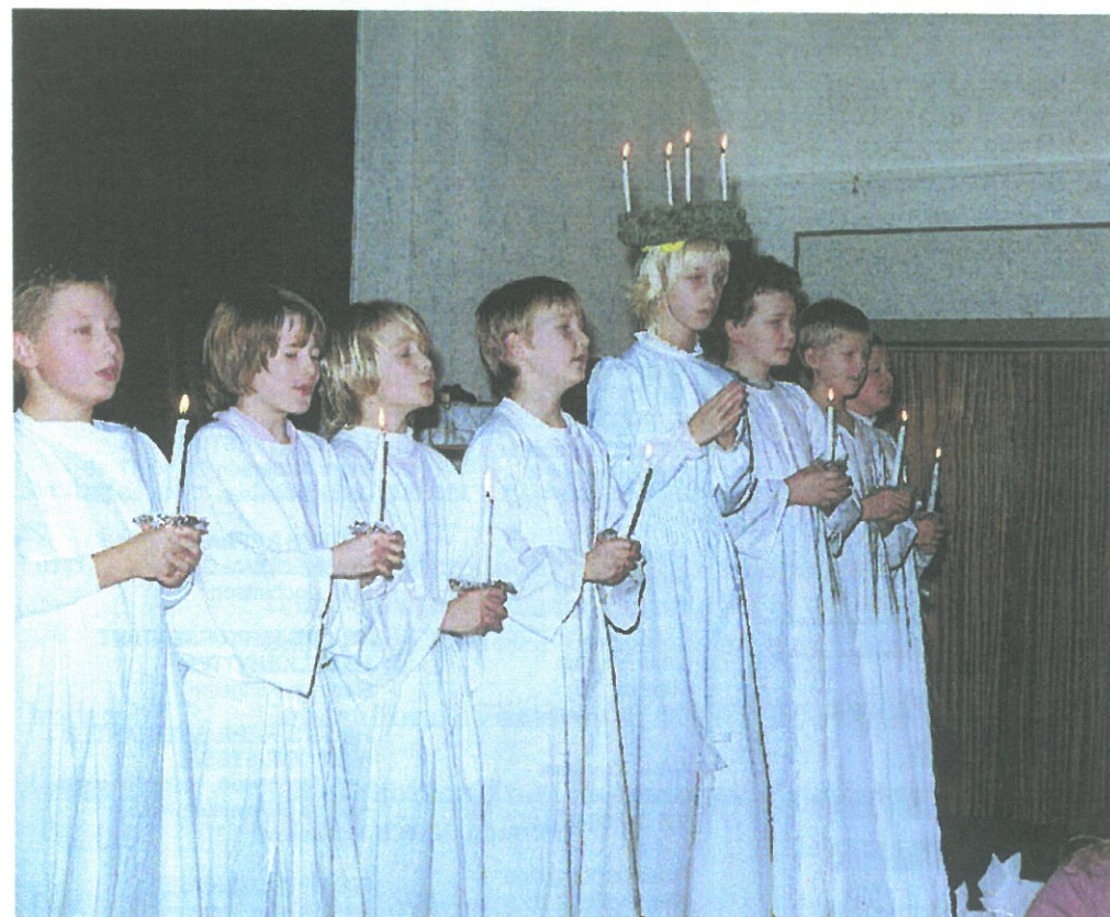
Billedet er fra Seniorklubbens juleafslutning i forsamlingshuset. 3. kl gik luciaoptog.

Husk mødet for nye beboere Tirsdag den 28. februar 2006 kl.19 i HSI's mødelokale