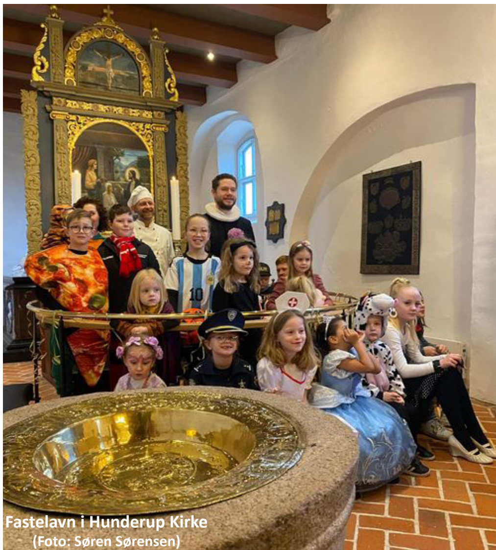
Fastelavn i Hunderup Kirke