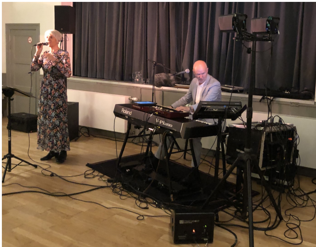
Billede fra Seniorklubbens juleafslutning