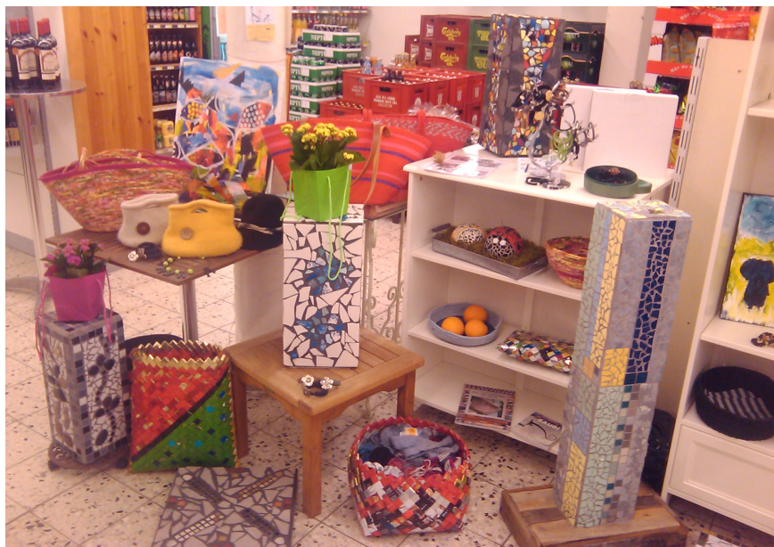
Nogle af Idéforums produktioner