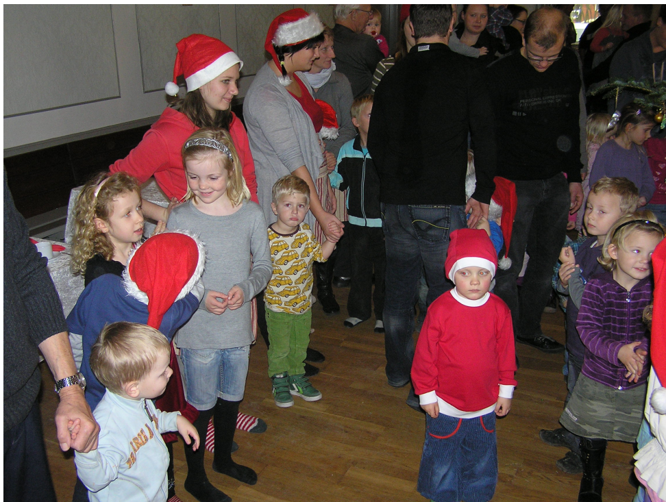
Fra sidste års juletræsfest i forsamlingshuset.

mvh. Bestyrelsen - Sejstrup Forsamlingshus