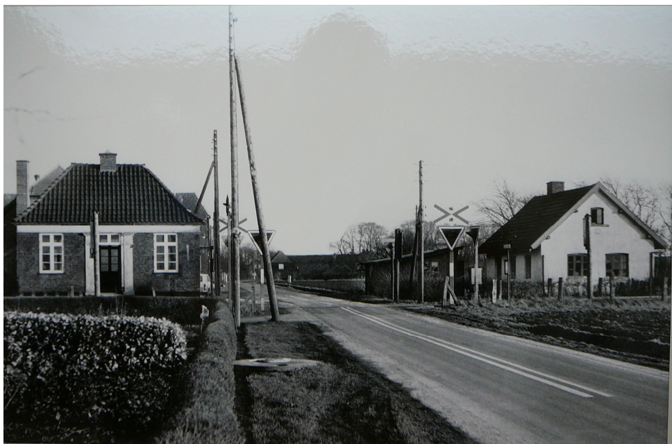
Ventesal og ledvogterhus ved Sejstrup Station. Nedrevet i 1970.