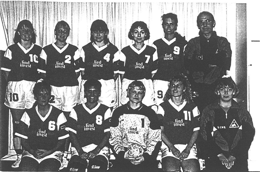
HSUG/DGU DAMER SERIE 3 (OPRYKKET)