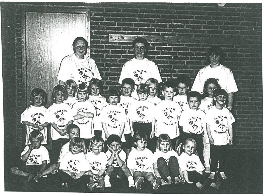
DET YNGSTE BØRNEIDRÆTSHOLD