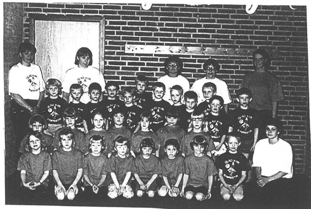
DET ÆLDSTE BØRNEIDRÆTSHOLD