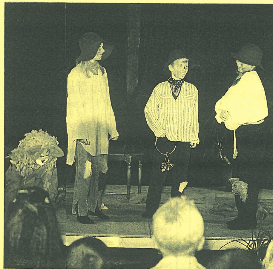
5. klasse fra Hunderupskole opførte „Folk og røvere i Kardemommeby“, ved skolefesten i Idrætssalen.