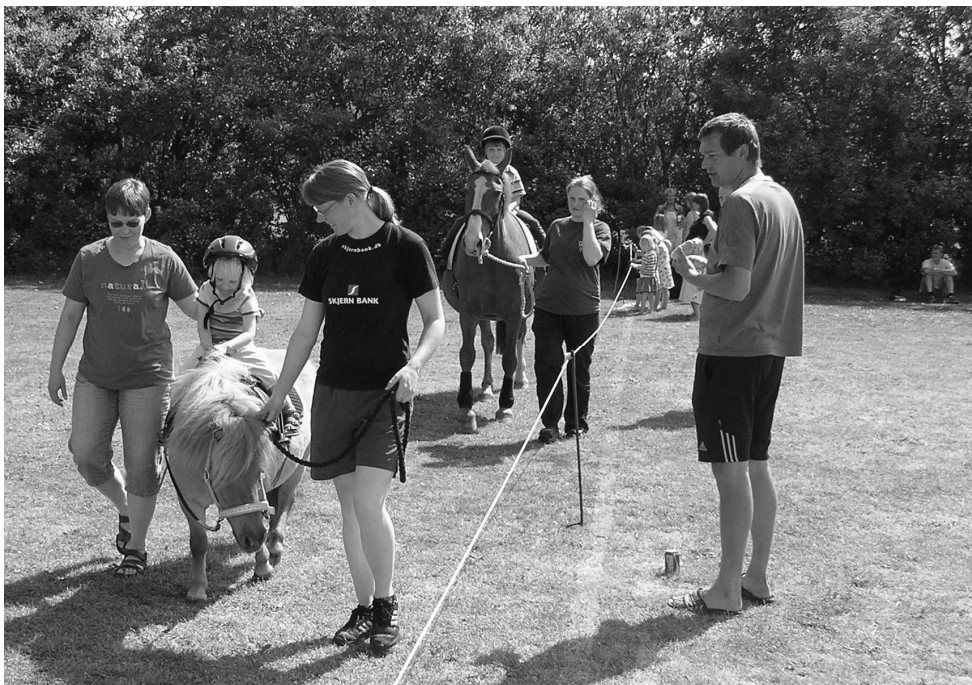
Heste- og ponyridning var populært.