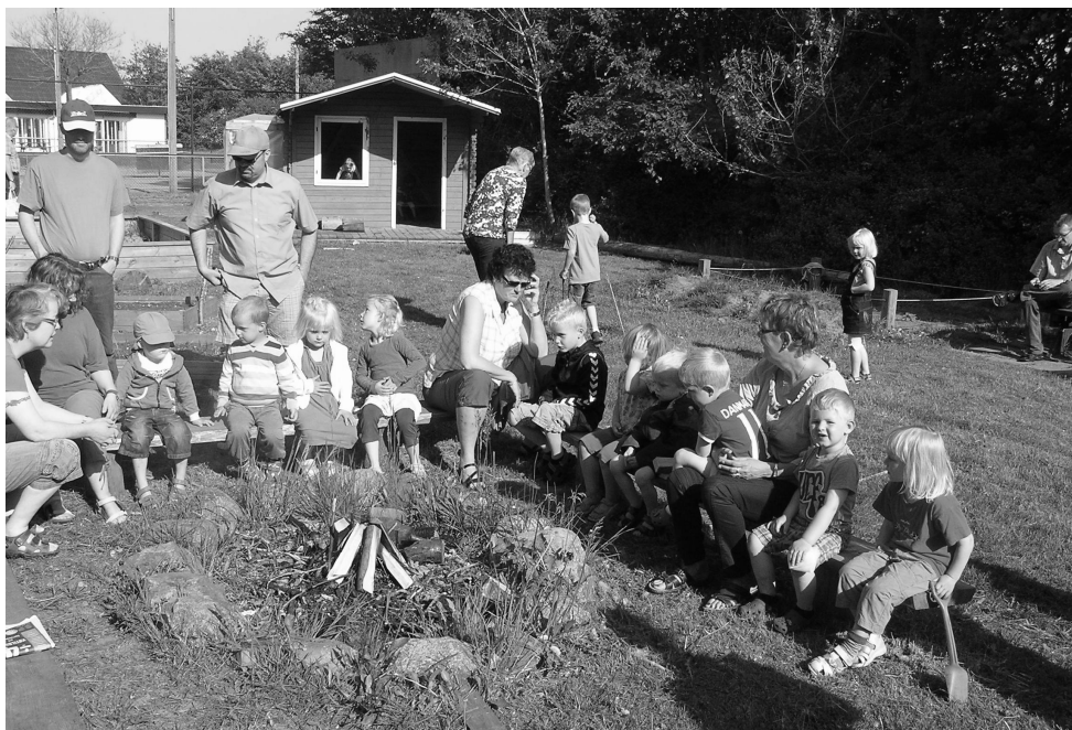
Bedsteforældredag i børnehaven