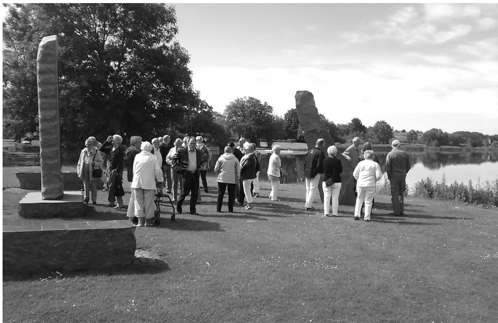
Seniorklubben ved mindestenen ved Haderslev Dam