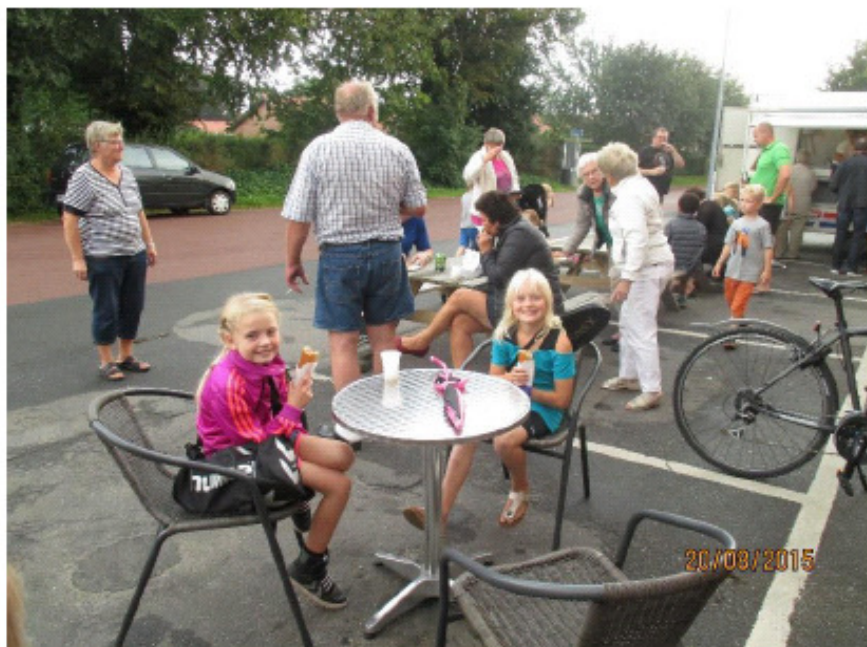
2 friske piger