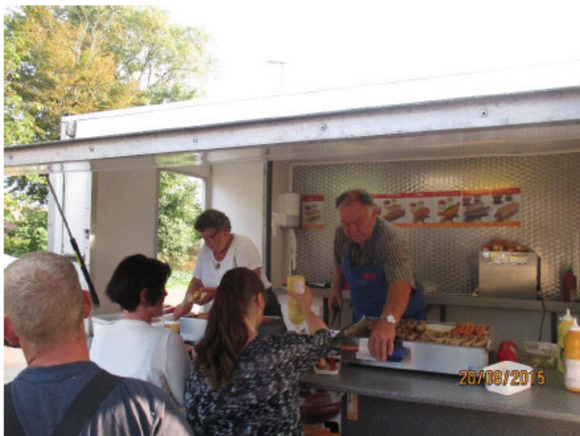
Der var meget travlt ved pølsevognen