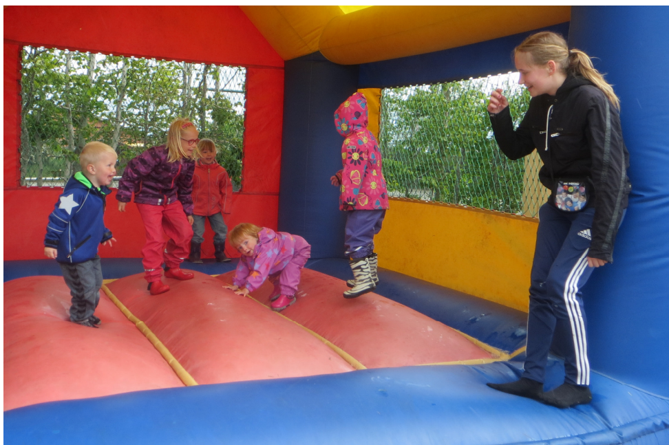
Situationer fra Landsbyfesten