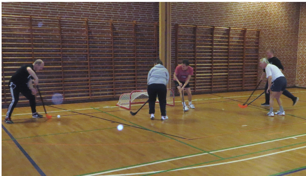
Her ses 3 af aktiviteterne ved "Åben Hal" arrangementet.