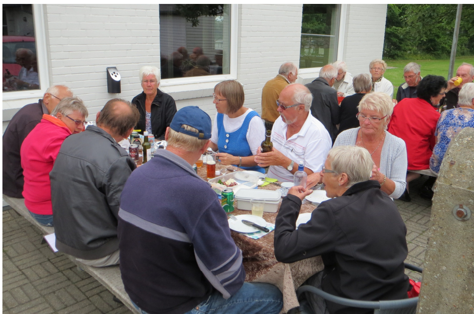
Hyggestund efter veloverstået petanqueturning