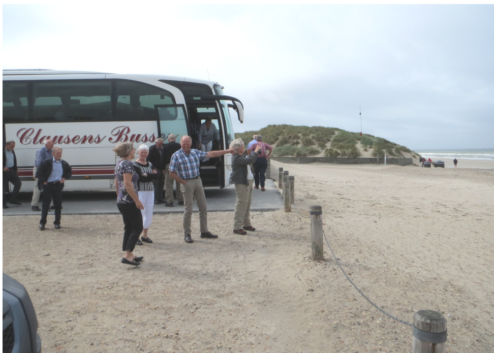
Seniorklubbens udflugt gik bl.a. til Henne Strand og krigsgravpladsen i Oksbøl