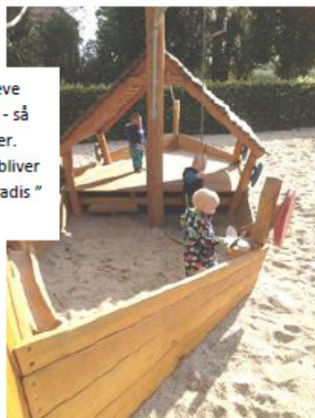
OH-HØJ i gæve landkrabber - så letter vi anker. Næste stop bliver " Bentes paradys "

Ved " Høstmarkedet " i Kratskellet, havde vi stillet vores legeplads-telt op. Her havde jeg vores " sanse legesager " med, som børn op til 4 år kunne komme og prøve. De kunne føle hvad der gemte sig i poserne, kravle i tunneler, ligge i en ballonseng og lege " jorden er forgiftet " på de mange forskellige balance ting.