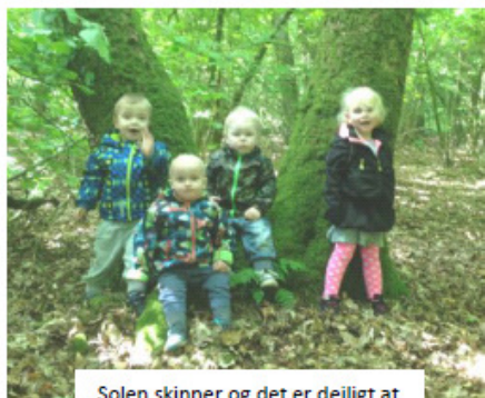
Solen skinner og det er dejligt at være i skoven.