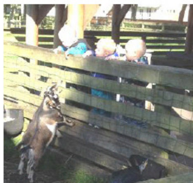
Hvad er det for nogle underlige fyrer der står der på den anden side af hegnet – det spekuleres det nok på, fra begge sider af hegnet, tror du ikke ☺