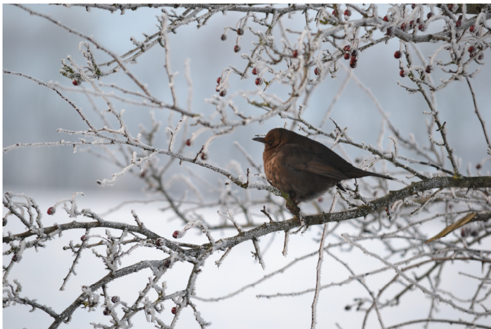
Vintermotiver fra Sejstrupvej