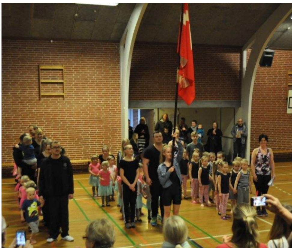
Indmarch ved gymnastikopvisningen i hallen