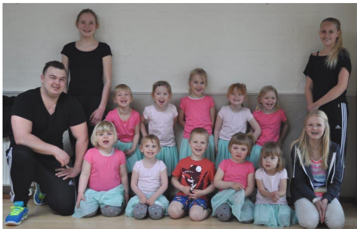
Gymnastikholdet 3 - 4 år