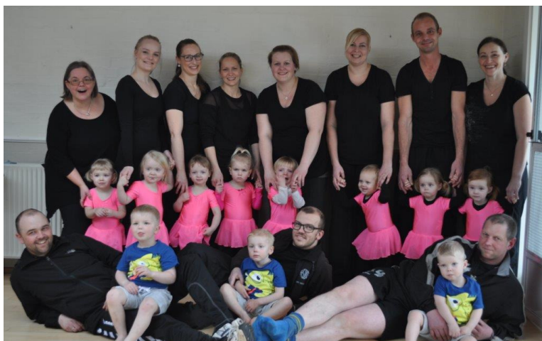
Gymnastikholdet Mor, Far, Barn