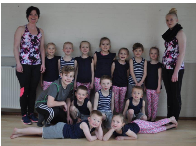
Gymnastikholdet 5 år-0. kl.