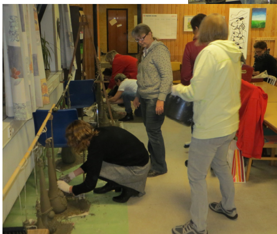
Billeder fra Idéforums seneste aktiviteter.