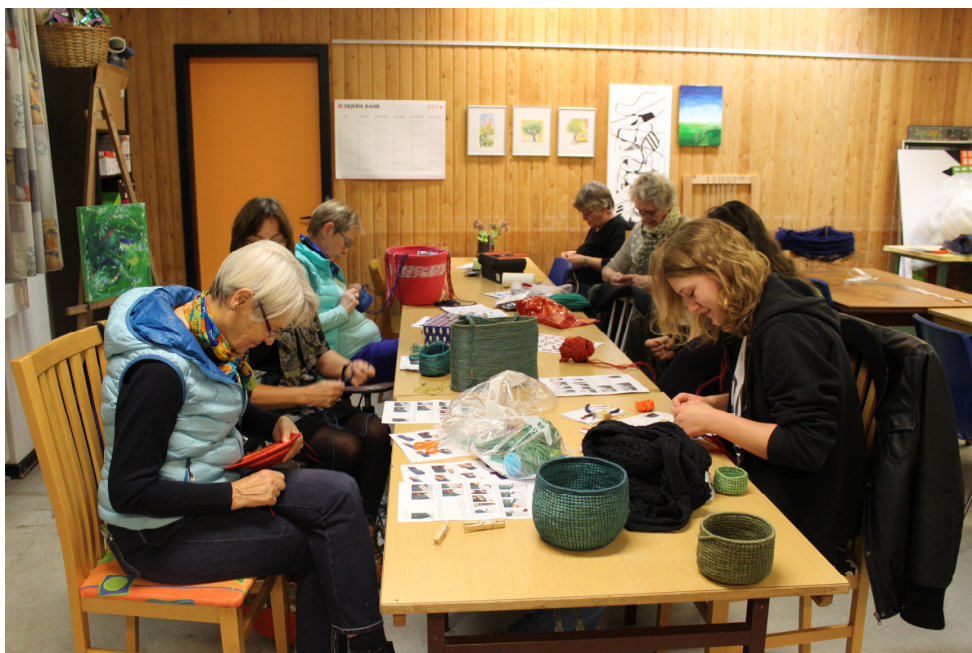
Kursisterne i arbejde.