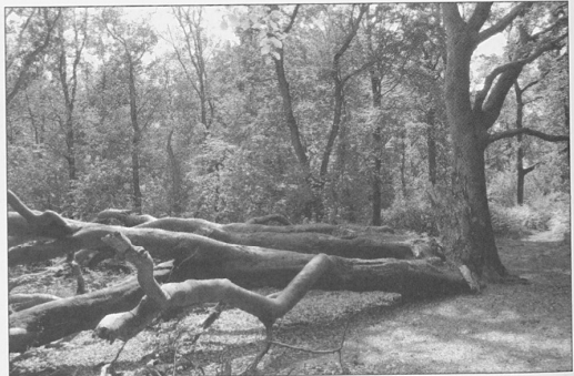
Den gamle Bøg i Hollænderskoven blev alvorligt skadet ved en vinterstorm – først fotograferet år 2000, så år 2004

alt for mange hegn og vandløb, så vi foretrækker Fruerlundvej, selv om den ind imellem var lidt iset. Den 22. december var en våd og tung omgang, mens der den 23. og 24. var isskorpe, der rev i støvlerne. Så var den fornøjelse slut. Sideløbende med skiturene var vi i anlægget for at fjerne knækkede grene og trætoppe. Der er meget, der er knækket. Det skyldes nok, at træerne står tæt og derfor vokser sig lange og ranglede for at nå op i lyset, og derfor knækker de lettere. Heldigvis kunne isen på den midterste sø bære, så vi kunne fjerne grenene derfra. Mange steder måtte vi klippe dem fri af isen. Vi er stadig i gang med at hakke dem i småstykker, så de ikke fylder for meget i skovbunden.