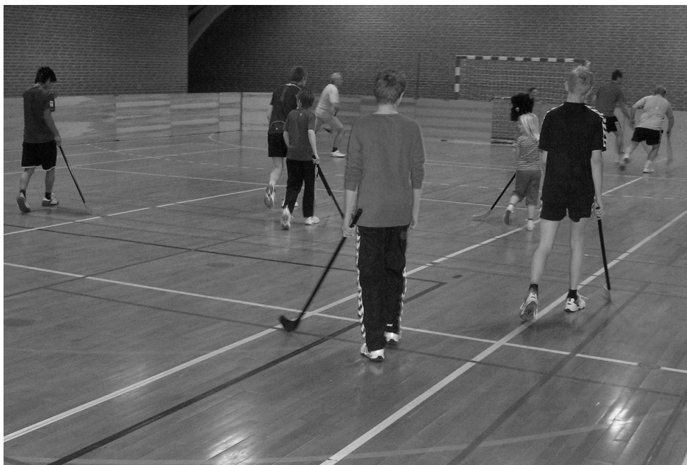
Hockeyarrangementet i hallen den 30. december