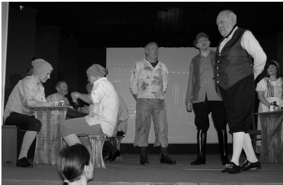
Fra Landsbyscenens opførelse af "Røverne fra Rold"