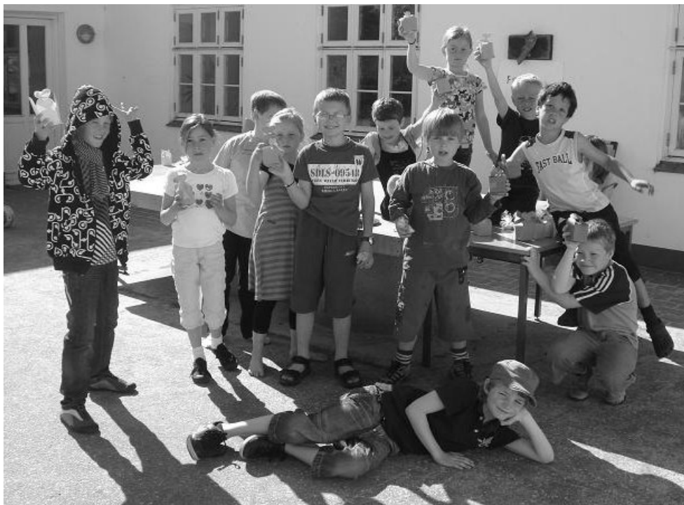
Billeder fra skolen