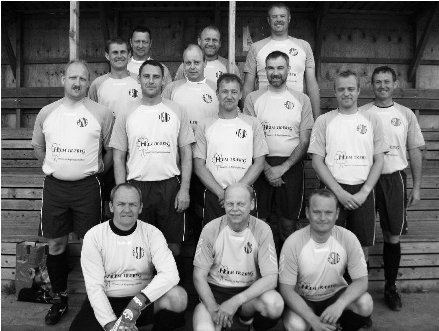
Oldboys-holdet med nye trøjer