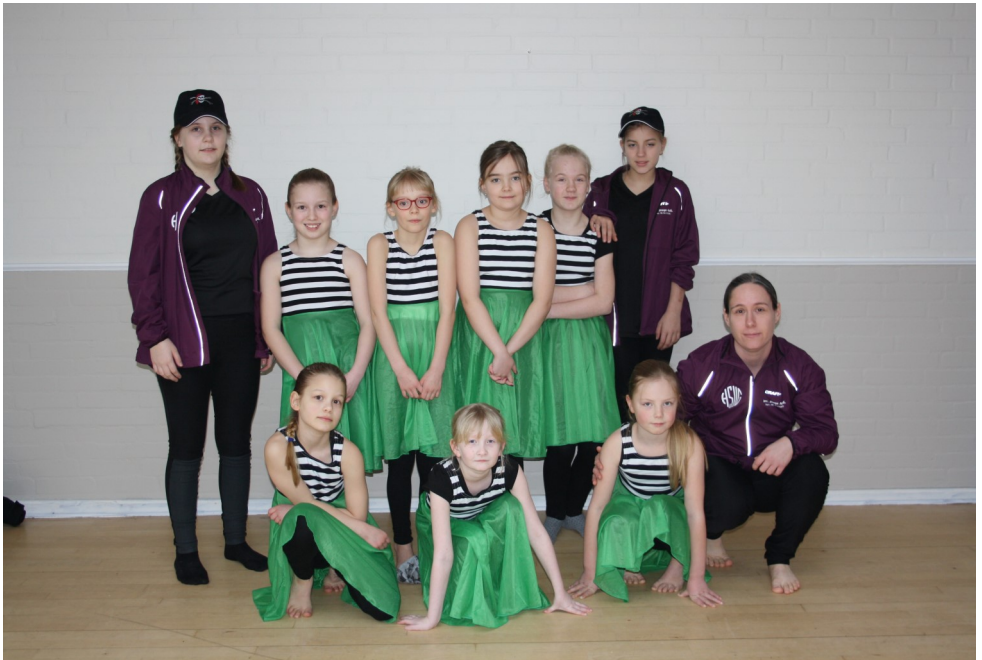
Dans/funk 1. - 4. klasse