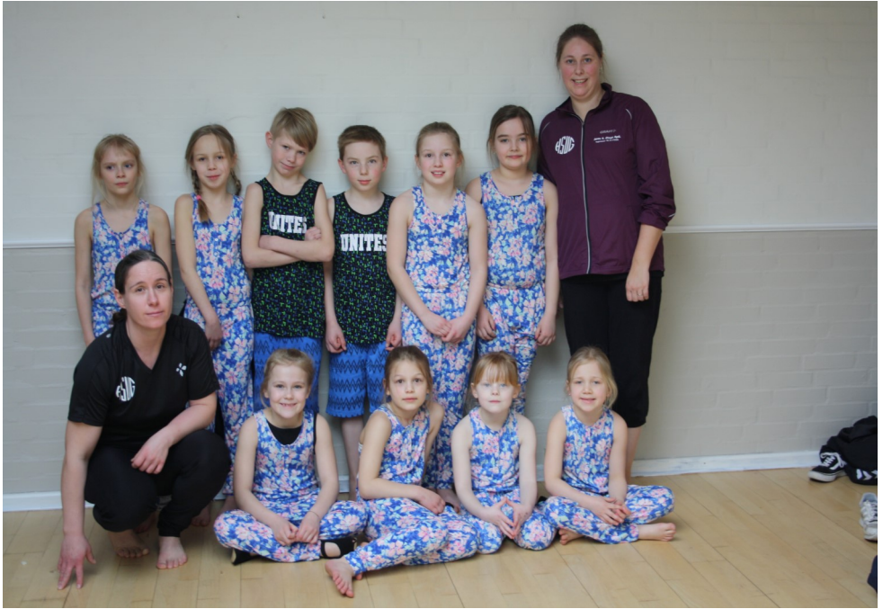
Springmix 0. - 3. klasse