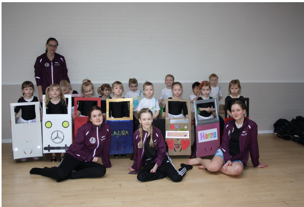
Gymnastik 3-4 årige