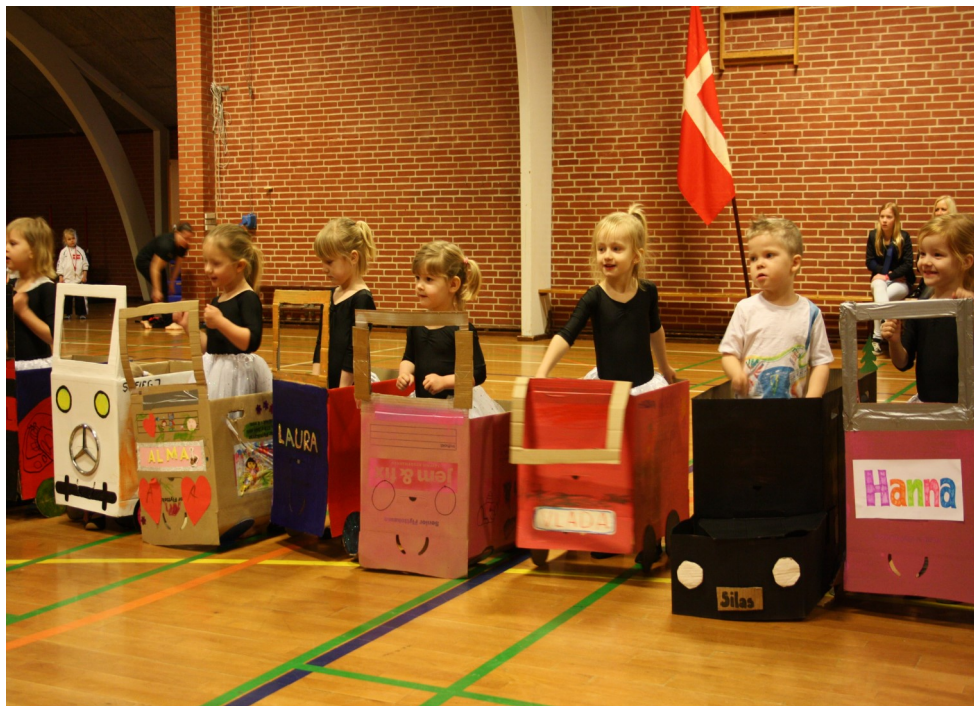
Dyt - båt. Kreativt indslag til årets gymnastikopvisning.