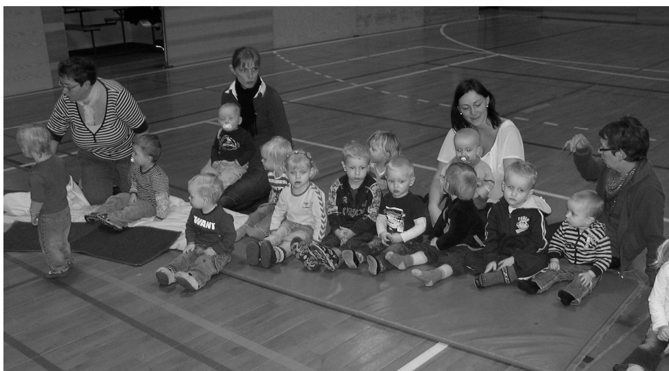
Børnehavens cirkusforestilling med dagplejen til generalprøve.