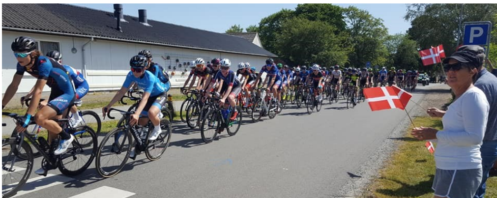
U19 Herrerne i fuld fart

De tilstedeværende havde det dejligt både lørdag og søndag, og da de