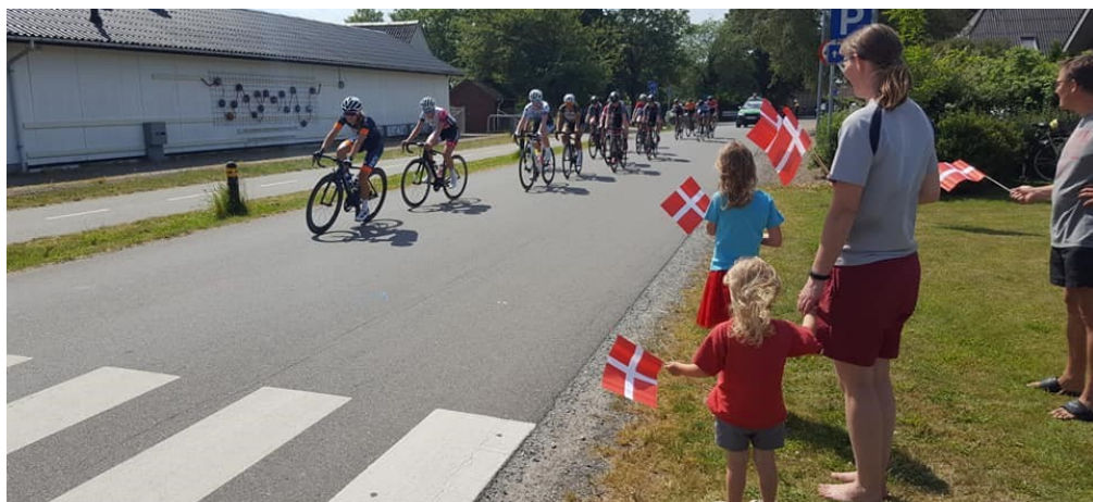
Damerne cykler og pigerne hepper

to felter passerede igennem "hårnålesvinget" fra Kirkevej til Kragelundvej, hujede og heppede vi så vi forhåbentlig lød som flere end vi i virkeligheden var. Vi ved ikke om de unge atleter lagde mærket til os; men de husker måske byen, hvor de blev oversprøjtet med kagekrummer, perlesukker og remonce fra flag der få øjeblikke tidligere havde været brugt som tallerkener.