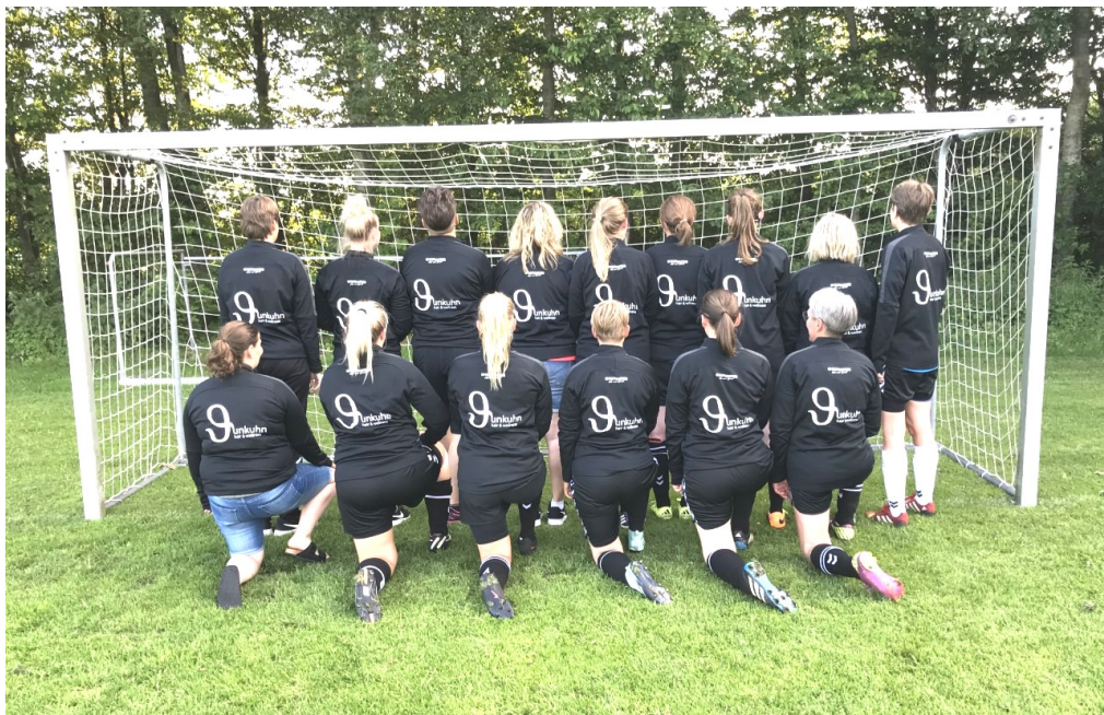
HSUG's kvindehold vil gerne sige tak til Salon Junkuhn og Martinsen, for sponsoraterne til vore nye opvarmningstrøjer.